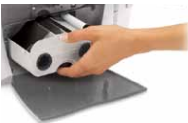
リボンの搭載も簡単 Personaの一体型プリンタカートリッジにより、リボンとクリーニングローラーの両方を一回で簡単にセットできます。

セキュリティはカードから HIDビジュアルソリューションは、写真付き身分証明書とアクセスカードの偽造を防止します。カスタムHoloMark™カード（最上）では、カード表面に3Dホログラムデザインが埋め込まれています。透明ホイルカード（上）には、カード表面のすぐ下に、ホログラムのウォーターマークが埋め込まれています。上記やその他のビジュアルソリューションにより、Persona C30eで製造したIDカードは偽造や改ざんが困難な一方、認証は簡単に行うことができます。