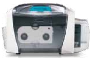
Persona C30e 片面印刷用プリンタ

世界各国の医療施設、大規模な交通システム、高速道路の料金所、駐車場、会員制プログラム、ポイントプログラム等において、薄型のプラスチックカードの人気は急速に高まっています。カードが薄型で柔軟性が高く、軽量なことから、郵送、患者のカルテへの添付、そして財布の中への収納が容易です。Persona C30eなら、他のプラスチックIDカードと同じように、優れた外観の薄型カードを簡単に製造できます。